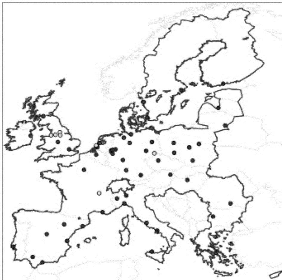
2. ábra: Az Európai Unió 59 valaha félmillió főnél népesebb nagyvárosa. A világos színnel jelzett városok népességszáma 2012-ben már nem éri el a félmillió főt Forrás: WORLD GAZETTEER alapján a szerző szerkesztése

város népességszáma haladja meg a félmillió főt elővárosok nélkül (2. ábra).