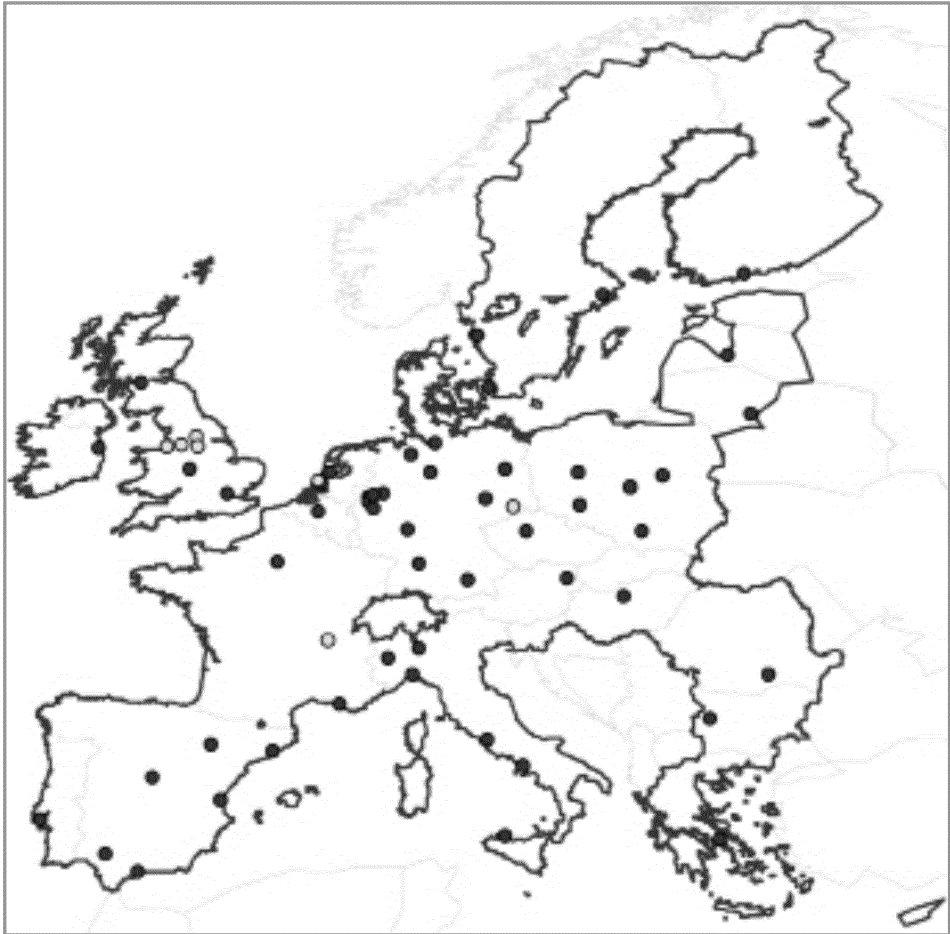
2. ábra: Az Európai Unió 59 valaha félmillió főnél népesebb nagyvárosa.

A világos színnel jelzett városok népességszáma 2012-ben már nem éri el a félmillió főt